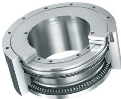
Lagereinheit für OP-Deckenstative mit elektromagnetischer Bremse

Wälzlager und Linearführungen sind zentrale antriebstechnische Komponenten. Sie arbeiten „im Zentrum der Bewegung“ und bilden deshalb den natürlichen Ansatzpunkt, um weitere Funktionalitäten zum Messen, Regeln und Steuern zu integrieren.