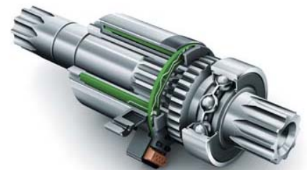
Leichtlauf-Sensor-Innenlager, integriert im E-Bike-Antrieb

Ihr Ansprechpartner im Schaeffler Vertriebsteam und unsere Mechatronik-Experten in der Anwendungstechnik diskutieren mit Ihnen gerne mögliche Ansätze, wie mechatronische Lösungen Ihre Anwendung weiter optimieren können.