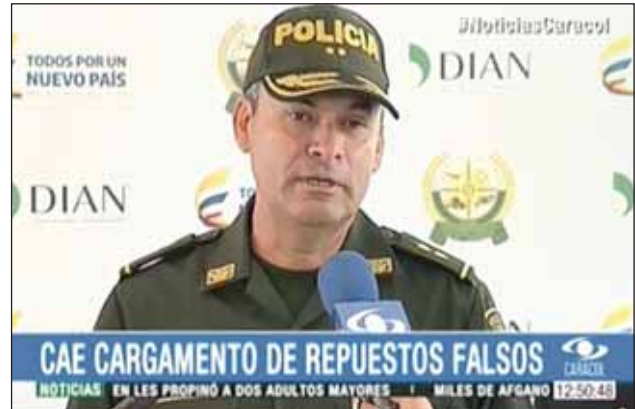
Az elkobozott hamisítványok hatalmas volumenén még a sokat látott hivatalnokok is meglepődtek – a politikai vezetés is tájékoztatást kapott.

Barranquilla, 2016. február 15. Egy nap, amelyet egy több városban is üzlettel rendelkező, csapágyakat forgalmazó cég tulajdonosa biztosan nem fog hamar elfelejteni. Ahogy máskor is, kinyitotta üzletét. Ám a folytatás ezúttal a szokásostól eltérő volt. Az üzletébe hatósági emberek jöttek Schaeffleres szakértők kíséretében. A tulajdonos rémülten vette őket észre: „Már megint?” – fakadt ki, amikor rádöbben, hogy ismét ellenőrizni fogják.