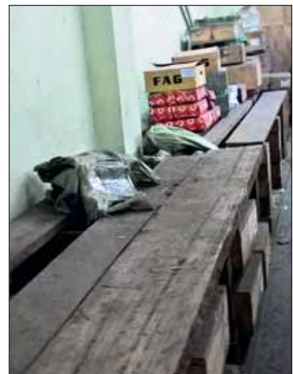
A kereskedő raktára Barranquillában az események előtt és a lefoglalás után.