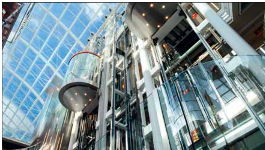
Felvonókban a szigetelt FAG beálló görgős csapágyak zajcsillapítóként hatnak...

Azért, hogy minden alkalmazáshoz felszerelhető legyen, sokféle opció áll rendelkezésre: Például választani lehet kétféle tömítőanyagot, többféle zsírt és zsírfeltöltési szintet.