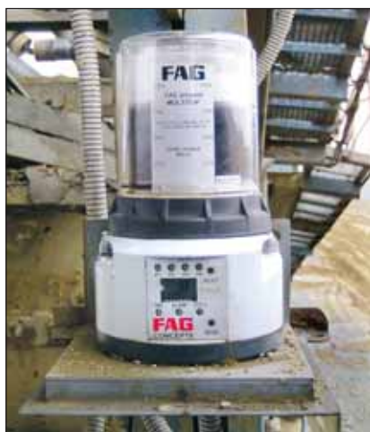
FAG CONCEPT8 Arcanol MULTITOP kenőzsírral a szalagfeszítő dobcsapágyakhoz

A visonta bányai tapasztalatok alapján olyannyira elégedettek a Schaeffler megoldással és az együttműködéssel, hogy a jövőben szóba jöhet a bükkábrányi bányában történő telepítés is.