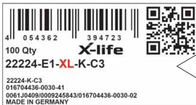
A beálló görgőscsapágy új megnevezése – pirossal kiemelve példacímkén és lenn a táblázatban

hat-kilenc hónapig egy tájékoztató szöveggel egészülnek majd ki. Azt reméljük, hogy így meg tudjuk előzni az esetleges félreértéseket, és csökkenteni tudjuk a reklamációk számát. Ezen tájékoztatók az árukísérő dokumentumokon tételspecifikusan tartalmazni fogják mind a régi, mind az új (XL) elnevezést.