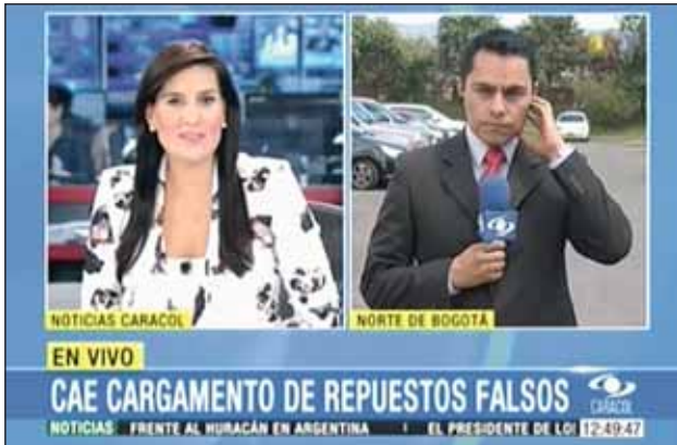
Még a kolumbiai televízió is élőben számolt be a lefoglalásról.