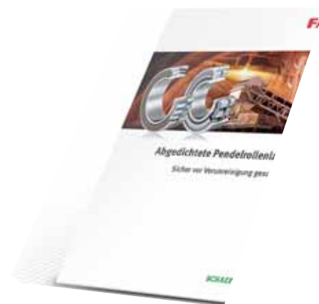
További információ a TPI 218-as nyomtatott kiadványban található.

A nagy kereslet miatt folyamatosan bővítjük termékportfóliónkat. Jelenleg a következő szigetelt csapágyak kaphatók: 222-es sorozatszám (22205 – 22226), továbbá a 240 és 241 sorozatszám 320 mm-es külső átmérőig.