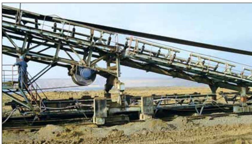
Meddő szállítószalag Visonta Bányában