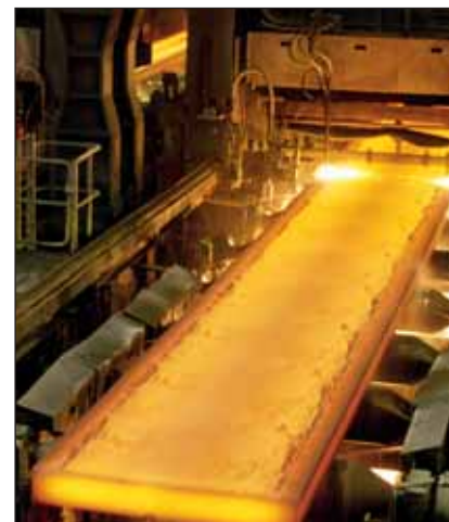
... a hengerműben is számít a jó tömítés.