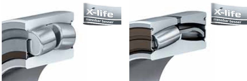
WS22214-E1-XL-2RSR-H40 szigetelt FAG beálló görgős-csapágy